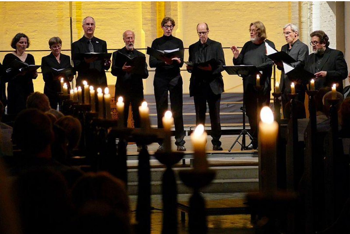
Die schola cantorum st. stephanus in der Hauptkirche St. Petri, Hamburg